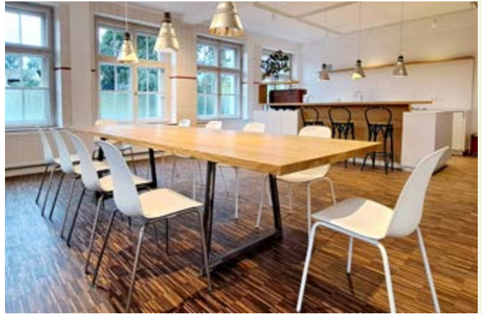
Ein Doppelzimmer im Alten Schulhaus und die Gemeinschaftsküche, die einst als Klassenzimmer diente.