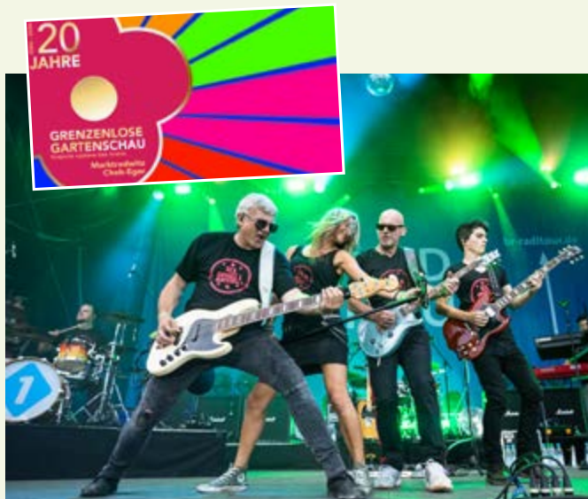
Bilder: Pauline Sticht (Logo), Hans-Martin Kudlinski