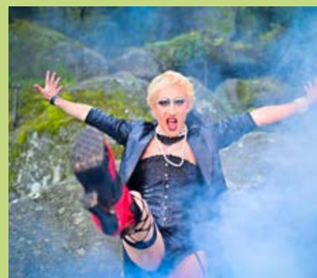
ACHTSAM MORDEN (m.), ROCKY HORROR SHOW (u.)